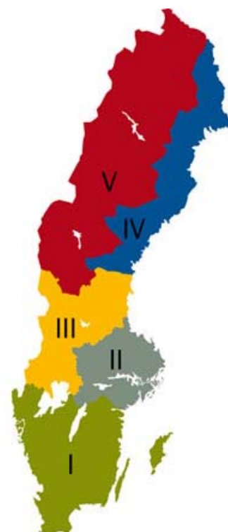
Skogsfastigheter, kr/m 3 sk, genomsnittspriser